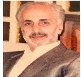
مرحوم حاج سيد محمود سيف افجه اي ايشان استاد دانشگاه و مدتي نيز سفير جمهوري اسلامي در تونس بودند.